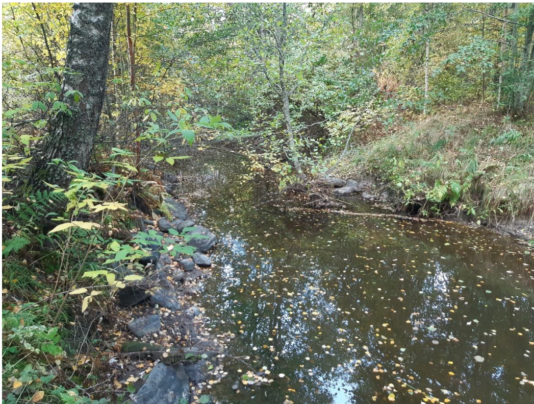
Kuva 8. Puuston ympäröimää uoma littalantien ja Äimjärven välisellä alueella.

Alue 3 (Iittalanti-Äimäjärvi) on kauttaaltaan hitaasti virtaavaa aluetta. Kuvissa 8 ja 9 on esitetty yleiskuvaus alueesta.