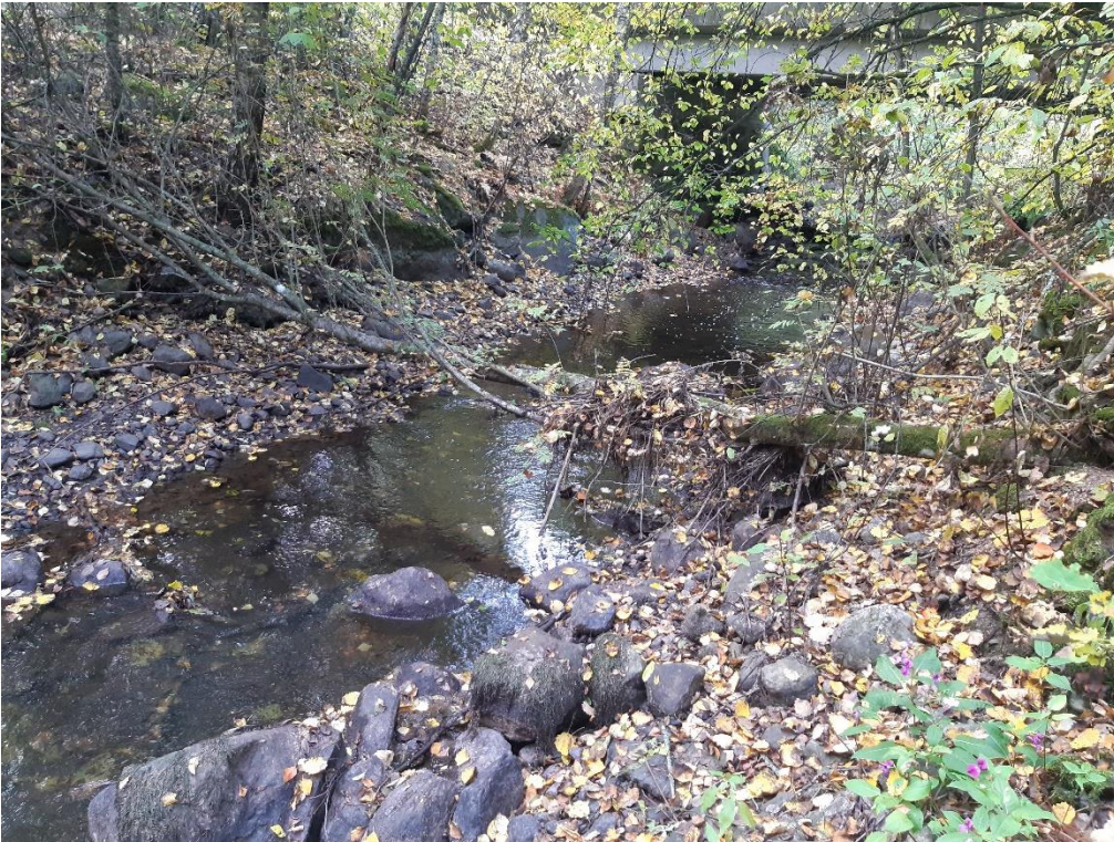
Kuva 4. littalantien kohdalla sijaitsevaa lyhyttä virtapaikkaa.

Alueella 2. Sijaitsee joen ainoa lyhyt koskialue, mikä muistuttaa lähinnä virtapaikkaa. Pituutta virtapaikalla on n. 25 metriä ja se sijaitsee littalantie kohdalla (kuva 4.). Lisäksi joessa on pieni pohjakynnys rautatiesillan alapuolella (kuva 5.) Muuten alue on hitaasti virtavaa jokea, mikä kulkee suurimmaksi osaksi peltojen keskellä (kuva 6). Jonkin verran on myös alueita missä uomaa reunustaa puusto (kuva 7).