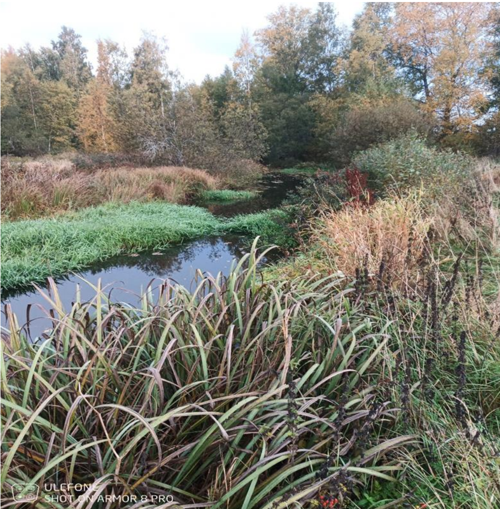
Kuva 3. Uoman ympärillä on paikoin runsaasti kasvillisuutta.