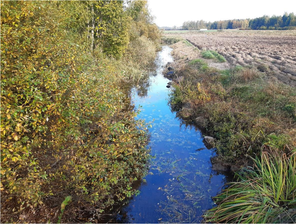
Kuva 6. Joki kulkee lähinnä peltojen keskellä