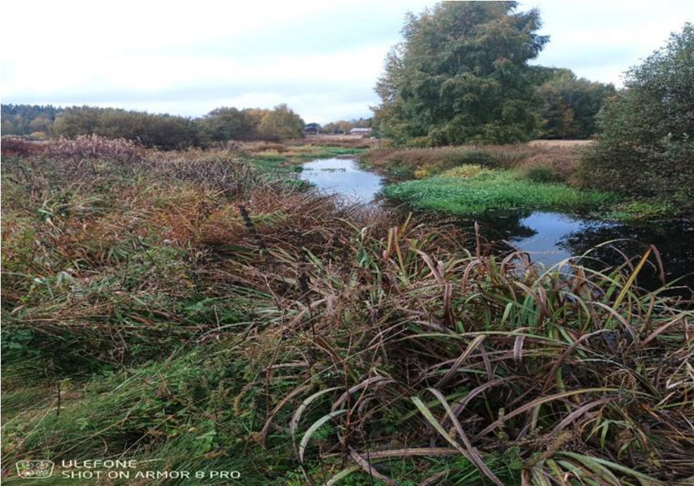
Kuva 2. Uoma on monin paikoin pahasti umpeenkasvanut