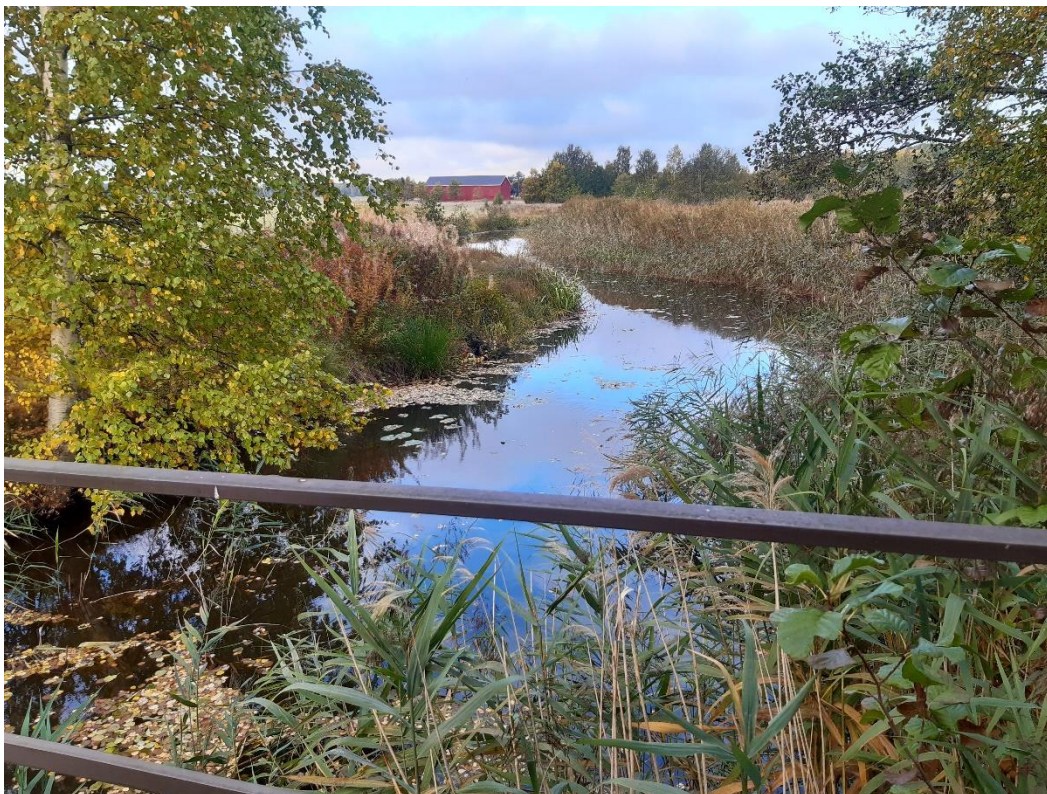
Kuva 9. Hitaasti virtaavaa joen yläosaa