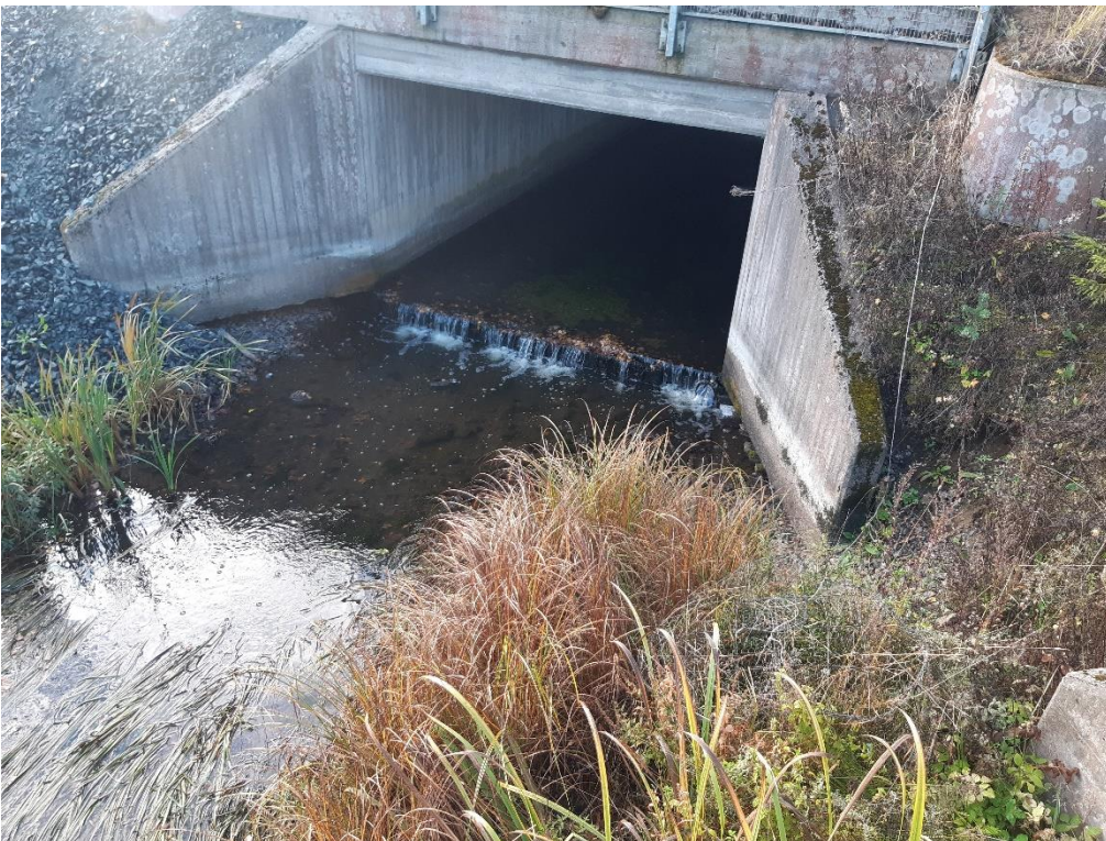
Kuva 5. Rautatiesillan kohdalla oleva pohjakynnys.